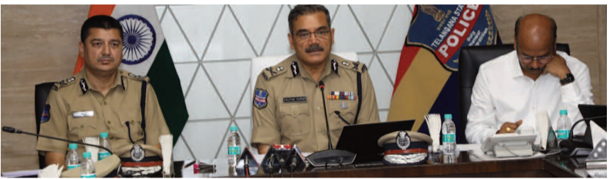
అధికారులు జారీ చేస్తున్నాయి.

అత్యవసరమైన పరిస్థితుల్లో మాత్రమే ప్రజలు బయటకు రావాలని డీజీపీ అంజలికూమార్ సూచించారు. చీఫ్ సెక్యూరిటీ డ్వారా ప్రతి జిల్లాలోని వర్గాలపై సమీక్షిస్తున్నామన్నారు. అడిషనల్ డీజీ లా అండ్ ఆర్డర్, గ్రే హోండ్స్, ఇతర అధికారులు డీజీపీ కార్యాలయం నుంచి పర్యవేక్షిస్తున్నట్లు వెల్లడించారు. 2900 మందిని రెస్ట్రాన్ చేసి పునరావాస కేంద్రాలకు తరలించినట్లు చెప్పారు. మోచంపల్లి వరదల్లో చిక్కుకున్న వారిని ఎన్ఎస్ఎస్ బృందాలతో